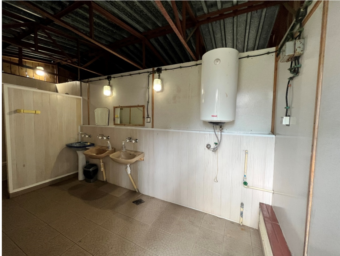
Pomieszczenie socjalne – toaleta na terenie zewnętrznym