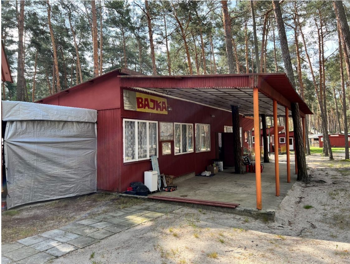
Pomieszczenie socjalne – umywalnia na terenie zewnętrznym